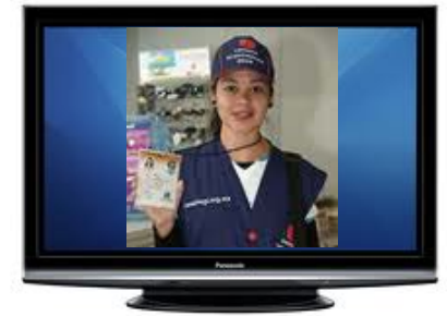
Cápsulas en video

Envío de resultados por correo electrónico a todos los informantes