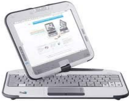
Dispositivo de cómputo móvil →

Prácticamente todos los grupos operativos lo utilizarán en alguna etapa del censo.