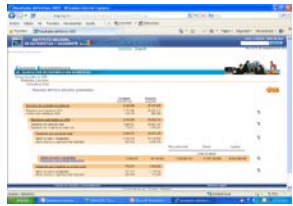
Sistemas de consulta en Internet