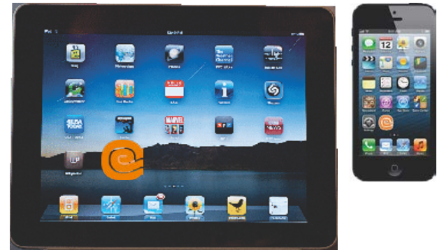
Widgets para smartphone y tablet