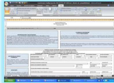
Hoja de cálculo por Internet

Prácticamente todos los grupos operativos lo utilizarán en alguna etapa del censo.