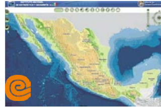
Atlas de los CE 2014