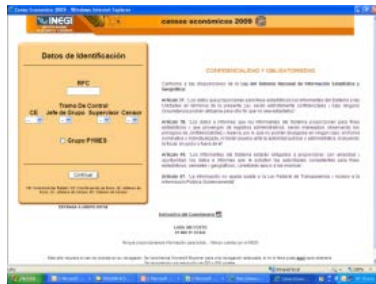
Cuestionarios por Internet

Será utilizado por las empresas conformadas por varios establecimientos .